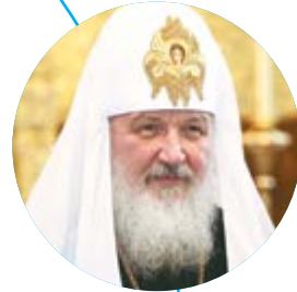
Святейший Патриарх Московский и всея Руси Кирилл

И конечно, одним из главных, ключевых проектов программы «Святость материнства» по праву считается проведение традиционных представительных форумов, которые пользуются высоким общественным признанием, служат авторитетной площадкой для выработки новых, отвечающих реалиям времени, идей и предложений».